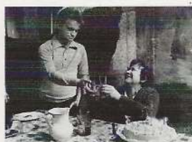
Merlin ou le cours de l'or