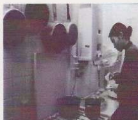
La Pierre de l'attente