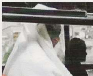
« Le secret de Fatima » de Karim BENSALAH Prix de la Francophonie 2006