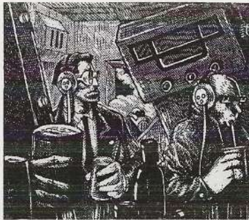
Pas de repos pour Billy Brako

Projection d'un Florilège de Courts métrages de Polars dont le film « Novela », de Cédric ANGER, scénariste du film « Le Petit Lieutenant » de Xavier BEAUVOIS « Pas de repos pour Billy Brako » de Jean Pierre JEUNET, « Close Up » de Claude FARGE avec Clovis CORNILLAC. « Taxi de Nuit » de Marco CASTILLA, « Le Caissier » de Frédérique PELLE (Grand Prix du court métrage au Festival de Cognac 2005), « Mauvais Temps » de J.Loup FELICIONI et « Affaire Libinski » de Delphine JAQUET avec Denis LAVANT.