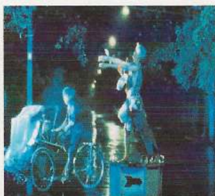
Cuoc xe dem