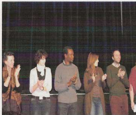
Le jury 2006

Depuis 7 ans, le Festival du Film Court Francophone de Vaulx-en-Velin propose une sélection de films courts placés sous le signe de la francophonie et de l'engagement avec des réalisations qui soulèvent les débats et bousculent les mentalités. Fictions, documentaires, animations, le FFCF met en avant la diversité des œuvres et devient l'espace d'une semaine un lieu de rencontres et d'échanges entre les réalisateurs et les festivaliers. L'occasion de découvrir des œuvres pleines de réflexion, d'émotions, souvent méconnues du public européen.